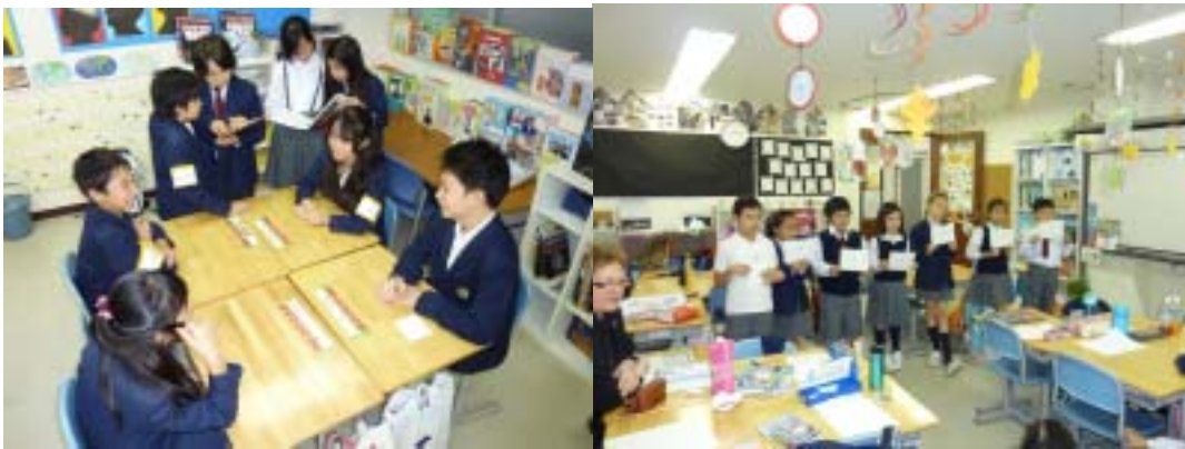
高校部 / 中学部 / 小学部 / キンダーガーデン (3~5 歳児)